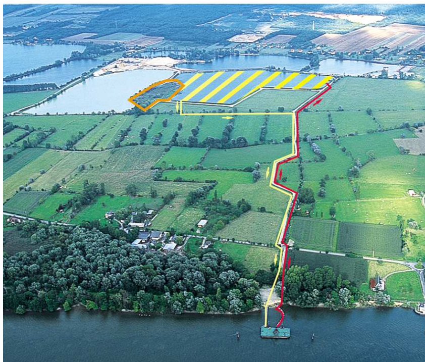
Vue aérienne de la ballastière d'Yville

Ce mode de gestion des sédiments de dragage constitue une alternative au stockage traditionnel en chambre de dépôt à terre de ces sédiments. Une carte générale de répartition des sites de dépôts (chambres de dépôt et ballastières) figure à la page suivante.