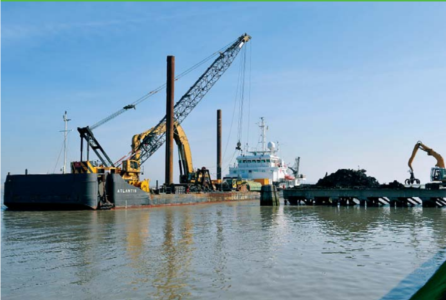
IMAGE : Enlèvement des épaves