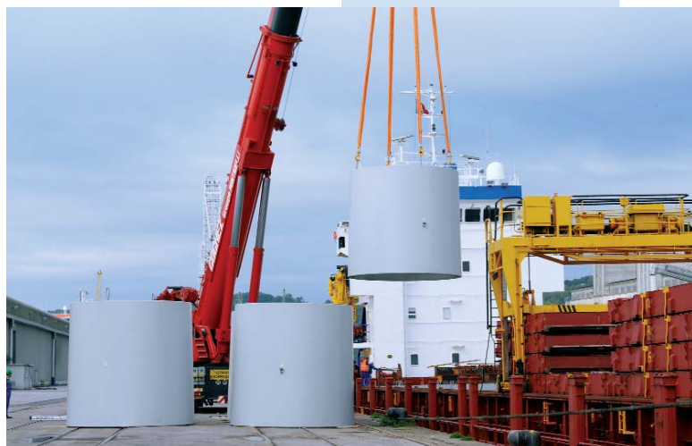
Le Nordersand a déjà importé à Rouen 12.500 t de sections d'éoliennes mais son chargement du 21 septembre est le plus lourd de sa jeune histoire

Quant au Nordersand sorti de chantier en 2004 et mis en œuvre par la compagnie allemande Briese Schiffahrts, c'est un habitué du Port de Rouen, avec des équipages particulièrement rodés aux transport d'éléments d'éoliennes. Le Nordersand , à lui seul, a désormais déjà importé 12.500 t de sections d'éoliennes sur les quais rouennais, transportant aussi du blé ou des engrais lors d'autres escales. Mais à l'escale du 21 septembre, il acheminait le plus lourd chargement "éolien" de sa jeune histoire.