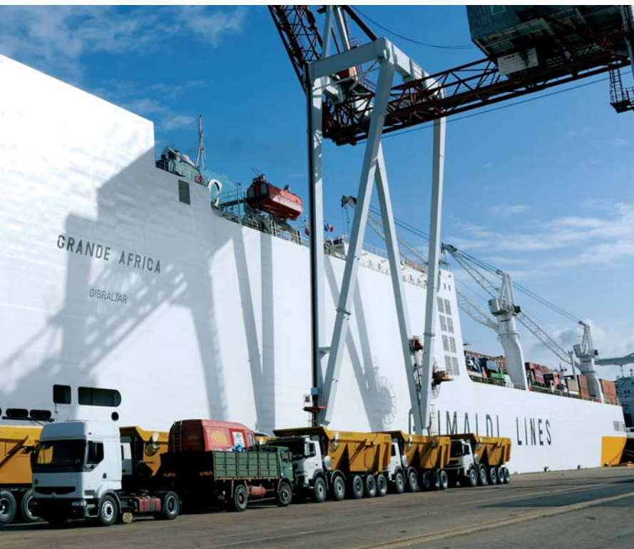
Le Grande Africa a embarqué des conteneurs ainsi que des véhicules neufs ou ayant été utilisés

Handling. Deux jours et demi de manutention furent nécessaires pour les éléments d'éoliennes destinés à un site du département de l'Oise. Paul Hébert, de Promaritime International, précise : "Ces sections en béton sont plus courtes : le chargement du navire est optimisé et, de plus, l'acheminement routier du quai vers le site éolien nécessite moins de convois exceptionnels."